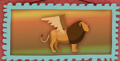
LEONE ALATO e SELVART Mezzaselva di Roana - Vicenza www.naturalarte.it

Luoghi di insolita bellezza vicino a casa nostra e non, tutti da visitare ed esplorare. Entra su ciascun sito e troverai ogni informazione. Davanti a te si svelerà... un museo "del bello" a cielo aperto!