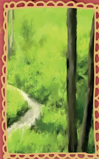
PARCO ROSSI Santorso - Vicenza www.parcorossi.it