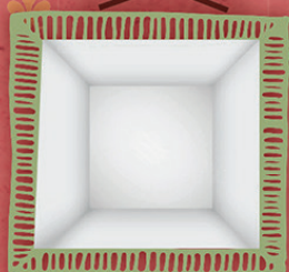
CUBO DI VETRO Valli del Pasubio - Vicenza www.dobbiamoandare.com