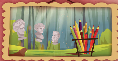
PARCO DEL SOJO Arte e Natura • Lusiana - Vicenza www.parcodelsojo.it

Vieni a trovarmi! Quest'anno è anche il mio anniversario... 200 anni!*